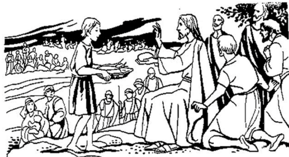
Jesús multiplica los panes y los peces para alimentar a la multitud (Mt. 14, 13-21; Mc. 6, 35-43; Lc. 9, 12-17)

A. Expón lo que piensas sobre el dibujo siguiente y pregunta al grupo qué es lo que ven en él. Pregunta al grupo si pueden identificar a qué episodio del Nuevo Testamento se refiere. Pide detalles de esta historia.