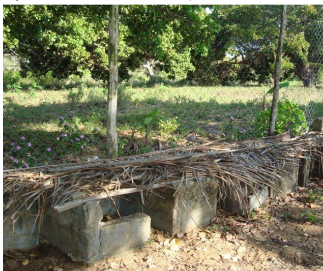
Ponederos donde llega la cobra

La maldita cobra volvió, nuevamente en Septiembre y el 14 de Diciembre. Pero esta vez, ya atacó a dos pavas que estaban engüerando y comió todos sus huevos. Por eso sabemos que es una cobra grande, porque apenas deja alguna cáscara, cuando engulle los grandes huevos de pava. Y ya ven, está terminando el año y nosotros sin encontrar pistas y caminos que nos lleven a descubrir esta hermana cobra, asesina y ladrona de nuestras gallinas y pavos. Pero no perdemos la esperanza, aunque en la noche no sea prudente ni seguro intentar matar una serpiente.