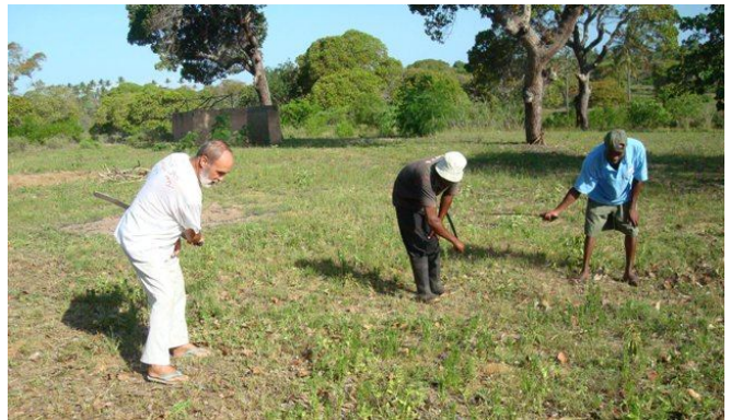
La limpieza del monte es nuestra defensa contra las cobras

El P. Querubín Fabbro, franciscano austriaco, santo misionero, a quien yo sustituí en 1977 a mi llegada, en La Misión de Chochis –Chiquitos, me